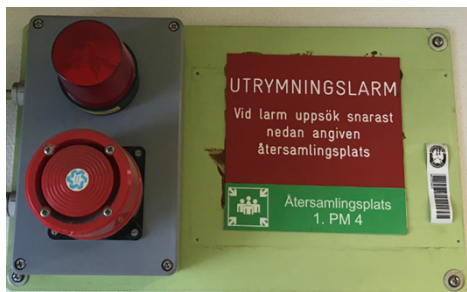
Larm för utrymning och återsamlingsplats

Test av Utrymningslarm sker kl 15:00 första helgfria måndag i mars, juni, september och december.