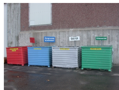
Behållare för sortering av avfall

Arbetsplatsen ska fortlöpande städas under pågående arbete. Med städning avses att överskottsmaterial, skräp, damm, vätskespill etc, avlägsnas. I detta ingår att tillämpa Gävle Bruks rutiner för sortering av avfall i olika fraktioner.