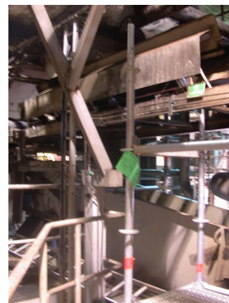
Ställning märkt med Grönt kort

Ev brister rapporteras till Gävle Bruks arbetsledning och kontaktperson för vidare hantering.