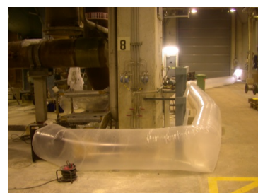
Kanaler för utsug av styrenångor vid arbete med hårdplaster

Rester av kemikalier får inte släppas ut i avloppssystemet. Processkemikalier, t.ex. produkter som är planerade att släppas ut i processavlopp ska i förväg ska vara riskbedömda och godkända av Gävle Bruks kemikaliekommitté.