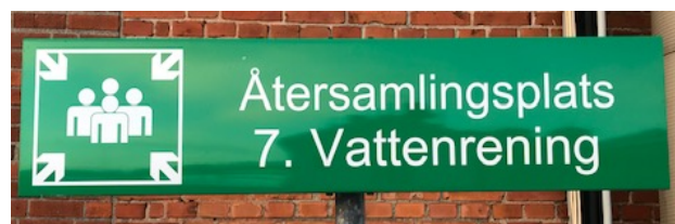
Exempel bild på återsamlingsplats