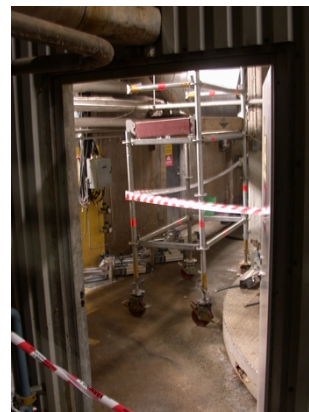
Tillfällig avspärrning vid högtrycksspolning

Ev brister rapporteras till Gävle Bruks arbetsledning och kontaktperson för vidare hantering.